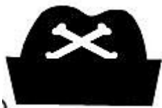
Foto Ihres Kindes hier einkleben

bitte den Namen hinten auf beide Fotos schreiben